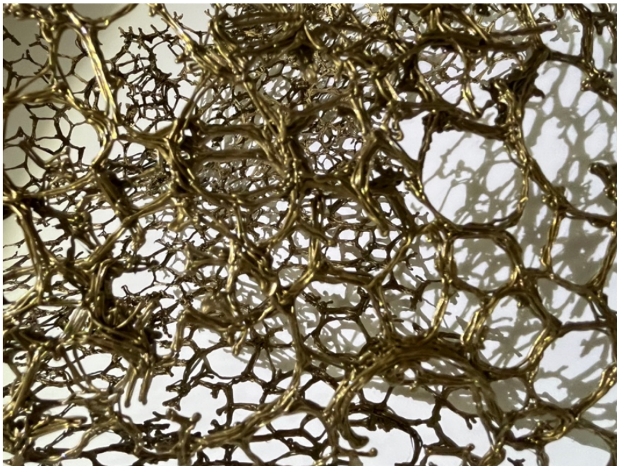
Caroline Gueye, Wurus , 2026. Detail. ©Courtesy the artist. Produit pour le Pavillon de la République du Sénégal, 61e Exposition Internationale d'Art — La Biennale di Venezia.

Pour le pavillon du Sénégal à la 61e Exposition internationale d'art - La Biennale di Venezia, Caroline Gueye collabore avec le curateur Massamba Mbaye sur Wurus (or en wolof), une exposition qui aborde l'or comme symbole de valeur et de pouvoir tout en s'interrogeant sur la manière dont la valeur elle-même devient perceptible dans le monde contemporain.